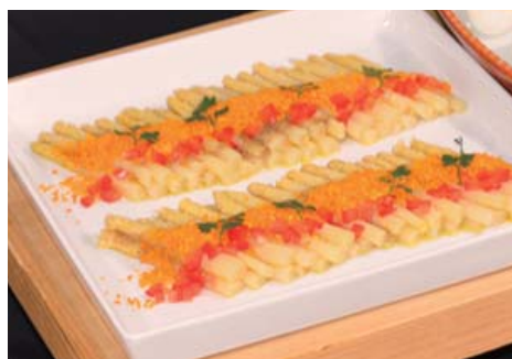
【ホワイトアスパラガスのマリネ卵ソース】