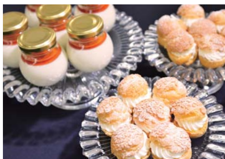
【まっしろ濃厚プリン&クッキーシュー】