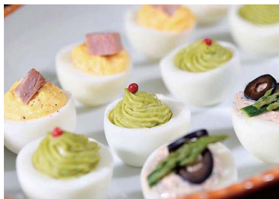
【アボカドとサーモンのフィリングイースターエッグ】

現在開催中のディナービュッフェに期間限定のイースターメニューが加わった春のながさき&イースターディナービュッフェが4月1日からスタート。話題の黄身も白い、まっしろな卵(ピュアホワイト ® )を使ったデザートやイースターエッグなど、イースターにちなんだ料理で春のお祭りをお楽しみください。