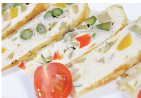
【白いたまごのフリッタータ】