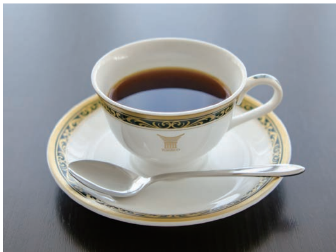
トアルコトラジャ

ベルベットのようなクリーミーな泡立ちのアイスコーヒー。 氷温熟成コーヒー豆を使用しました。そのままお召し上がりください。