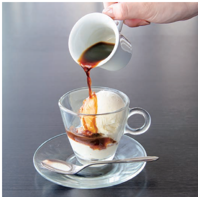
エスプレッソ アフォガート

イタリア・シチリア島発祥の「粒粒にする」という意味の氷菓。キャラメル味のフローズドリンクをお楽しみください。