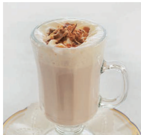
キャラメル・ミルクティー