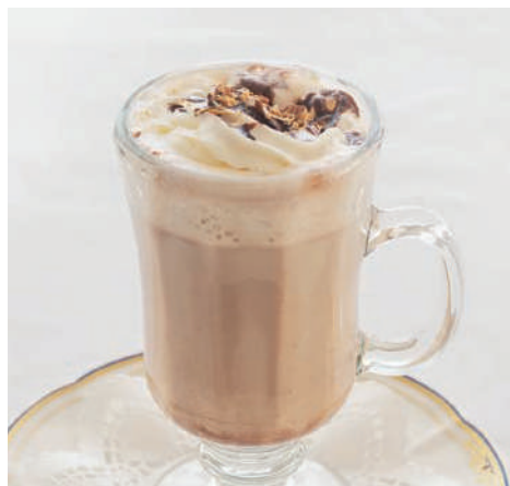
ダブルチョコココア