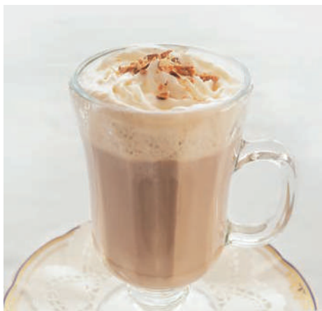
ナッツカフェ・オ・レ